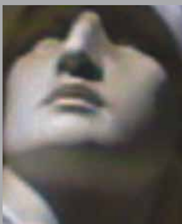
L'homme au casque