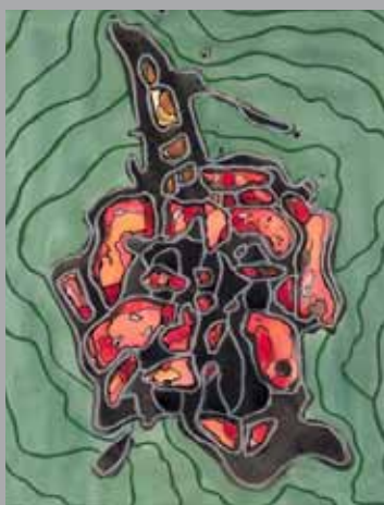
Série «cGrotesque 8»

Né en 1956, vit et travaille en région parisienne.