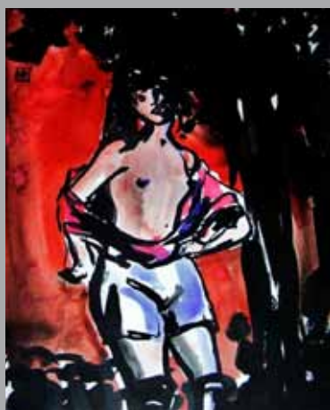
Fille du bois