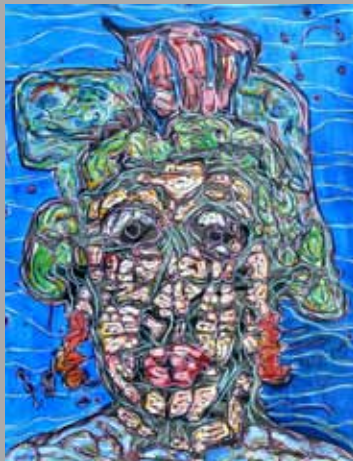
Série «Carmen épouvantée 2»