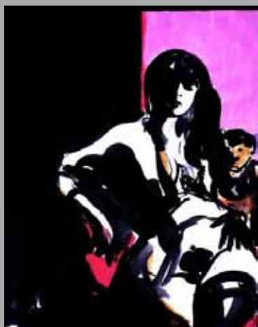
Fille au bonobo