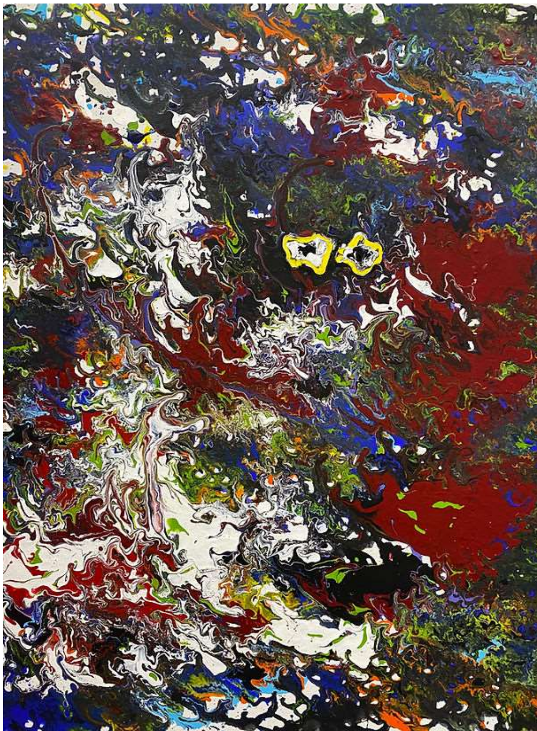
Chérubin , acrylique sur toile, 140 x 100 cm