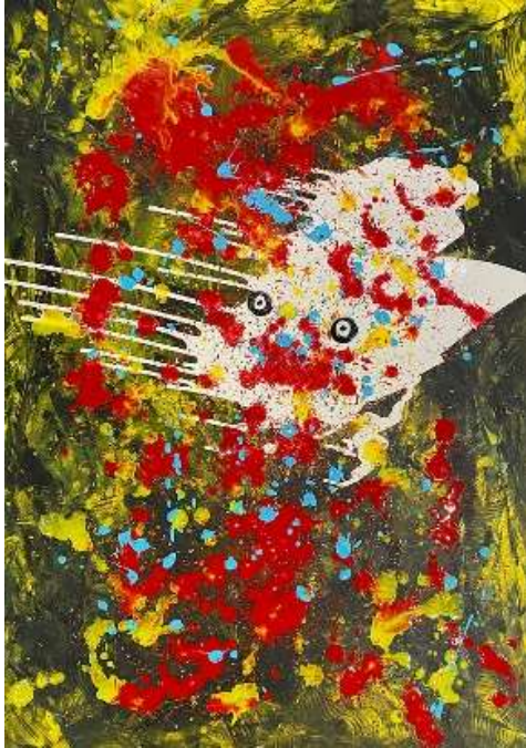
Embracement acrylique sur toile, 130 x 90