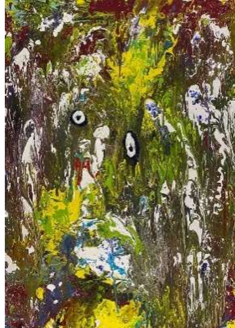
Fantasmagorie acrylique sur toile, 100 x 80