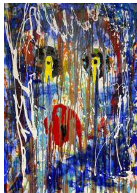
Pénélope acrylique sur toile, 130 x 90