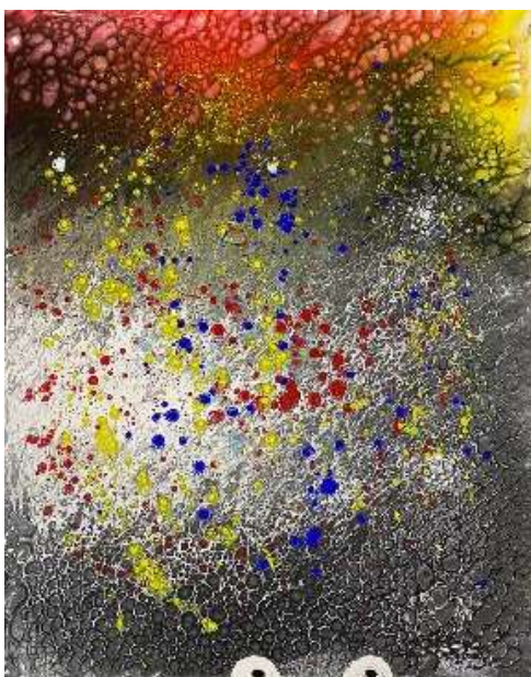
Samsara acrylique sur toile, 100 x 80