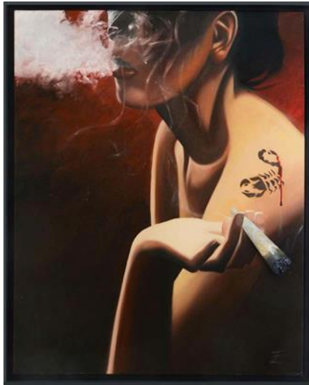
Toxique , technique mixte – 100 x 81 cm - 2016