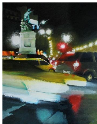
Rendez-vous Place Clichy , Acrylique sur toile, 116 x 89 cm