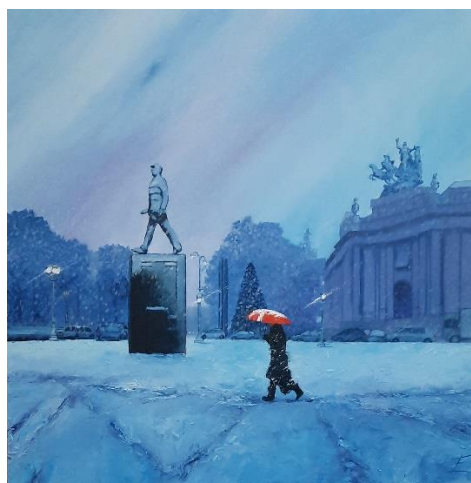
Le général sous la neige , Huile sur toile, 100 x 100 cm