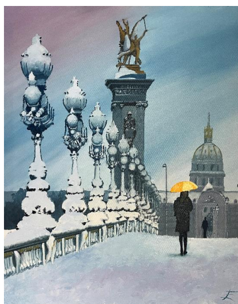
Jour de neige pour Alexandre , Huile sur toile, 100 x 81 cm