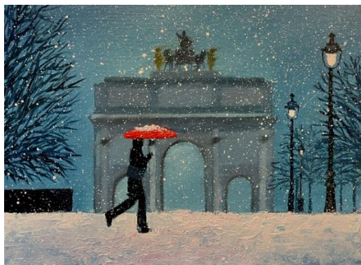
Carrousel de flocons , Huile sur toile, 30 x 40 cm