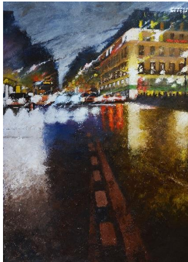
Opéra night , Huile sur toile, 100 x 73 cm