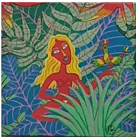
Conversation secrète , acrylique sur toile, 30 x 30 cm