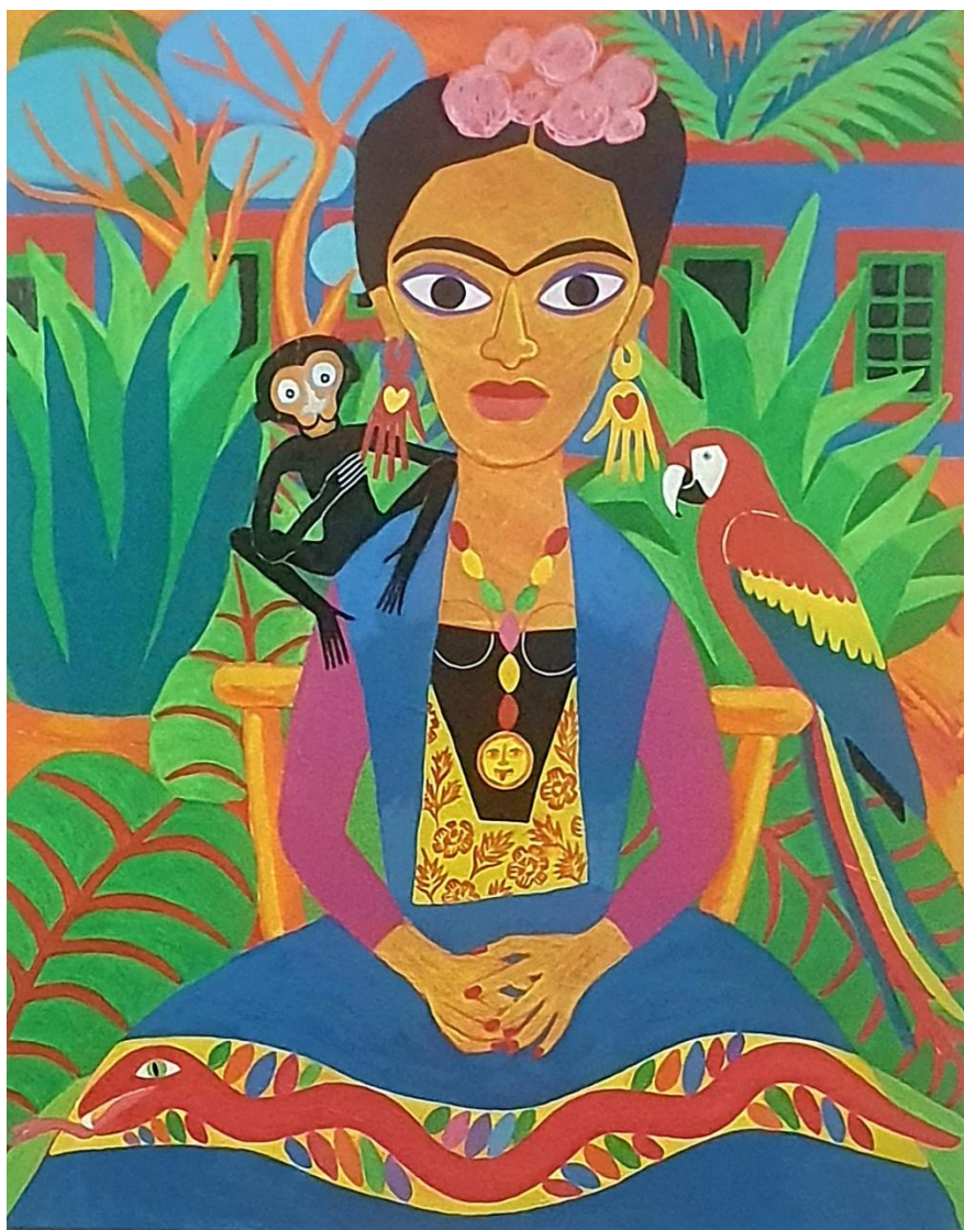
Frida Kahlo dans son jardin, huile sur toile, 92 x 73 cm