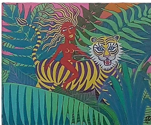
Tigresses , acrylique sur toile, 46 x 38 cm