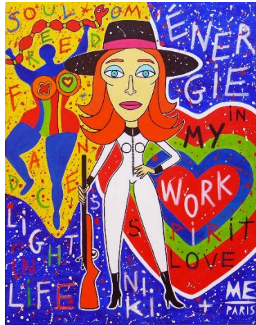
Niki de Saint-Phalle , acrylique sur toile, 92 x 73 cm