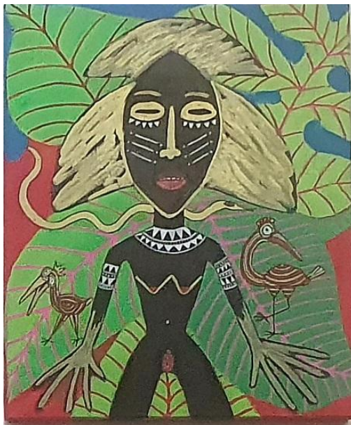
African Queen , acrylique sur toile, 46 x 38 cm